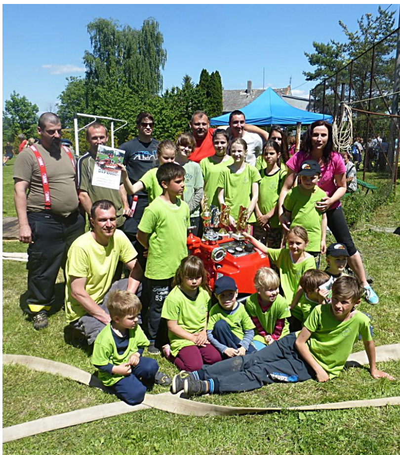
Hasiči z Klopotovic

Občasník o minulosti a přítomnosti naší obce Ročník XVII číslo 2/2017