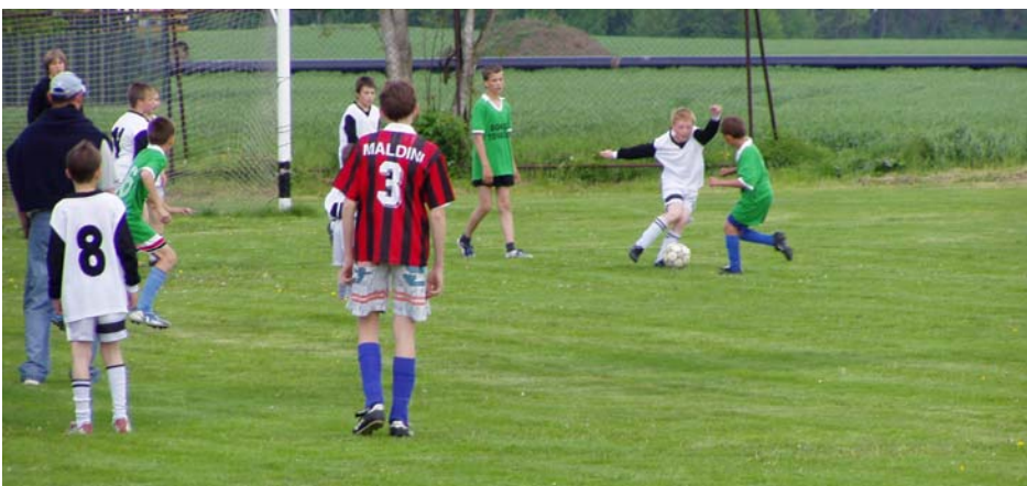
Ještě dopoledne v neděli bylo na hřišti sehráno fotbalové utkání žáků proti žákům z Biskupic.

Vydává Obecní úřad v Klopotovicích v květnu 2005; redakční tým: Zdeněk Klobouk a Petr Indrák; byly použity fotografie z archivů Tomáše a Petra Indrákových.