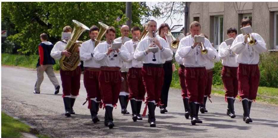
Budíček s Věrovankou a mažoretkami byl od 10 hodin.