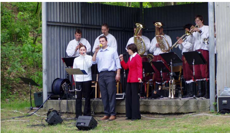
Odpoledne vyhrávala v parku Věrovanka a o další zábavu se postaraly mažoretky a také lidový vypravěč z Pivína.