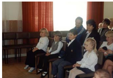
Další dva snímky jsou z vítání občánků a prvňáčků dne 15. září 2002.