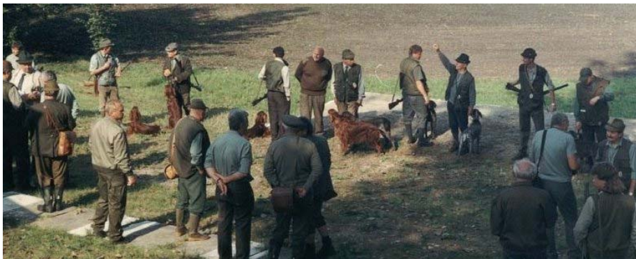
Myslivecká společnost uspořádala 7. září 2002 zkoušky psů na Podstrání.