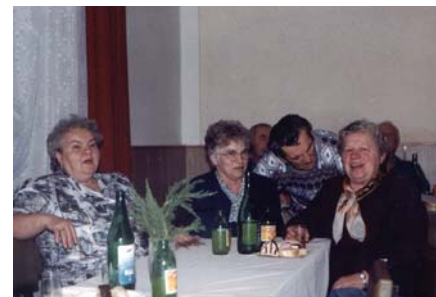
Začátkem prosince se uskuteční již tradiční setkání s důchodci. Dva snímky z minulého roku uvádíme hlavně pro ty občany, co se ještě nikdy tohoto setkání nezúčastnili, aby dostali odvahu a příště přišli.