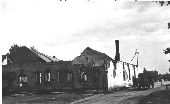
Jak je vidět na tomto snímku z války, hospoda tehdy byla až k silnici.