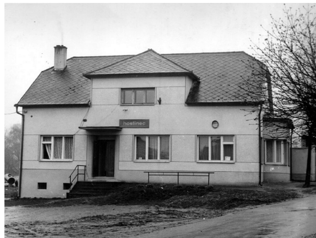
Dům číslo popisné 15, kde byla hospoda, dnes už je jen rodinný dům.

Letos jako každý rok OÚ uspořádá vítání občánků a setkání s důchodci.