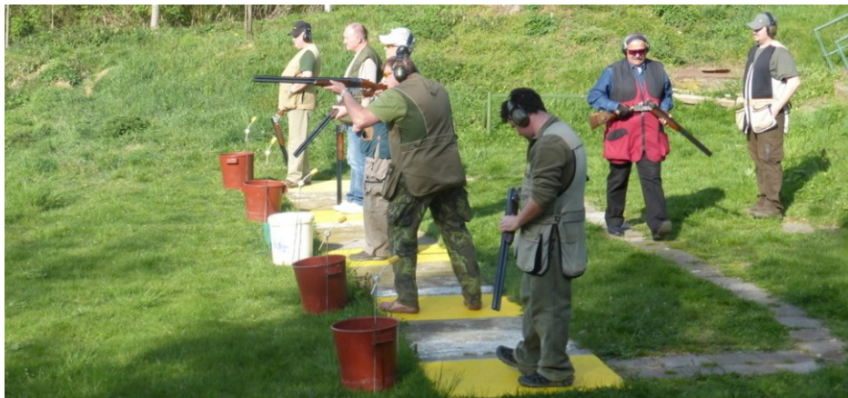
Jedno páteční odpoledne na střelnici, konkrétně 18. 4. 2014.