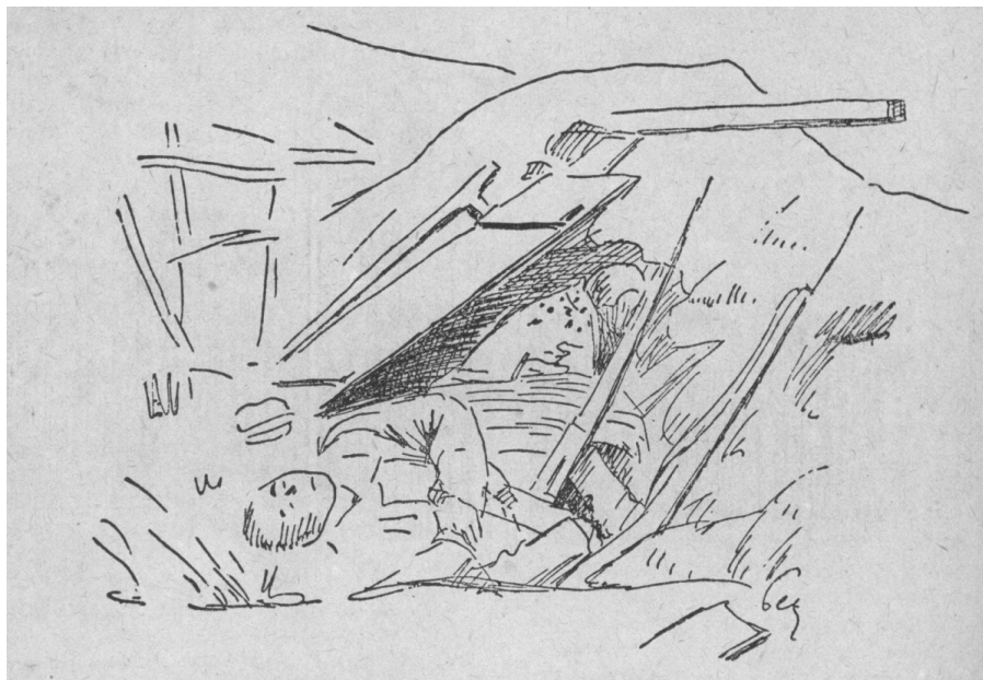
Dobojováno – srbský zákop u Bělehradu.