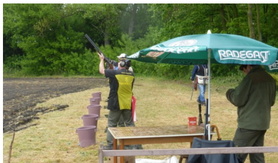
V sobotu 3. května uspořádala Myslivecká společnost Kralice na Hané střelecké závody.