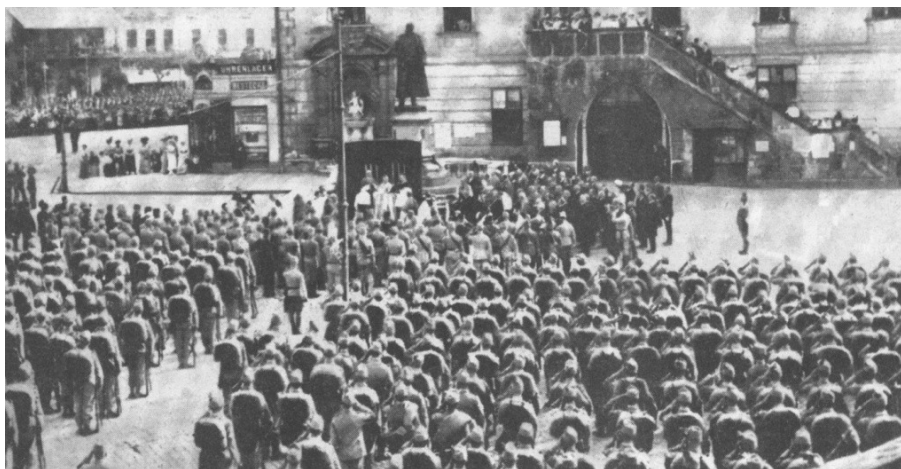
6. srpna 1914 Hanácký pluk z Olomouce odchází na frontu.

Vzpomínkou na oběti této kruté války, si zároveň připomínáme, že v této válce padlo deset našich rodáků, budiž několik dobových snímků a obrázků, které zde uveřejňujeme.