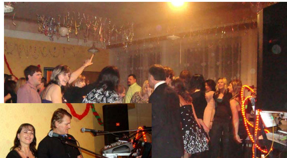
V sobotu dne 6. února 2010 se konal v zasedací místnosti Obecního úřadu Babský bál, který pořádal Český svaz žen.