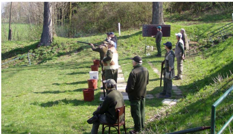
Myslivecká společnost uspořádala v sobotu 17. dubna 2010 na Podstrání střelecké závody.

tenoristou se stal v roce 1989. Osvědčil se také jako výborný aranžér v nejrůznějších hudebních žánrech a je rovněž úspěšným autorem několika hudebních skladeb. Pro Moravanku Jana Slabáka upravil mj. verbuňk „Ty Kyjovský purkmistrě“, vrtěnou „Nedaleko Kyjova“ a aranžoval valčík „Znám jednu myslivnu“. Po odchodu do důchodu v roce 2000 ukončil svou profesionální dráhu. Svůj volný čas věnuje rodině a užívá si důchodu. V těchto dnech slaví své 70. narozeniny a my mu u příležitosti jeho životního jubilea přejeme všechno nejlepší a hodně zdraví.