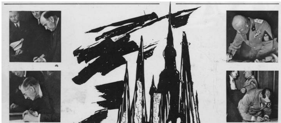
Aktéři mnichovské dohody: Hitler, Mussolini, Daladier, Chamberlain