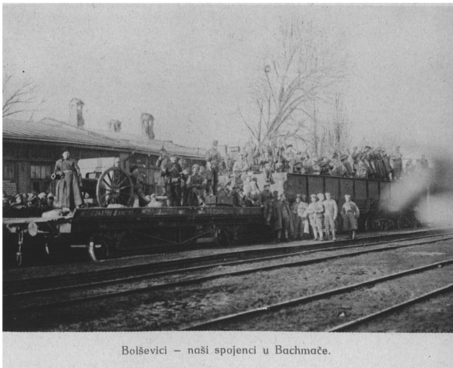
Bolševici – naši spojenci u Bachmače.

10. března - zpozorovala časně zrána předsunutá hlídka příjezdějíci německý vlak. Z bezprostřední blízkosti zahájila boj, pokoušejíc se zmocnit lokomotivy. Objevil se, ale další ešelon Němců - před touto přesilou musela čsl. stráž ustupovat a tak byla opuštěna také stanice Plíski, zatímco se všemožně ničila trať.