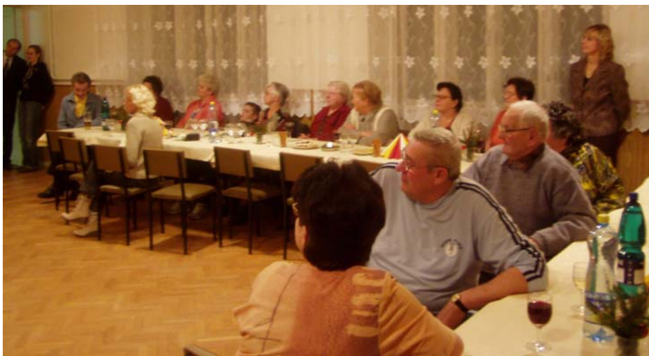
Setkání s důchodci se konalo v zasedací místnosti OÚ dne 7. prosince 2007