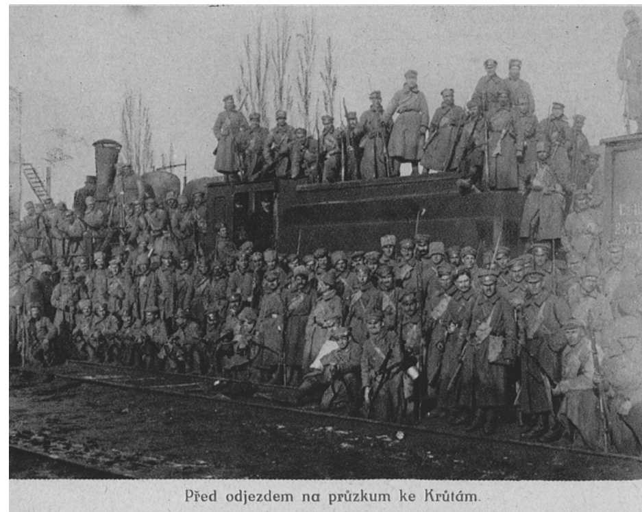
Před odjezdem na průzkum ke Krútám.

Přes všechna očekávání se tehdejší představitelé Ukrajiny nechovali k našim legiím přátelsky a požadovali jejich úplné odzbrojení. Odchod našich vojsk z Ukrajiny byl však ztížen nejen nedostatkem potřebných vlaků, ale také politickými poměry na Ukrajině – ukrajinská vláda uzavřela s Němci svůj separátní mír a to ještě před mírem Brest-litevským (3. března - 1918) a povolala na Ukrajinu německá vojska k boji proti bolševikům.