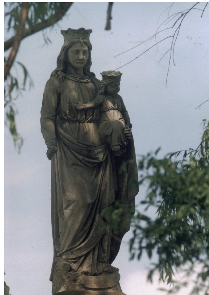
Socha Panny Marie Hostýnské – současný stav

Nezávislý občasník o dění v naší obci Rok 2008 číslo 1