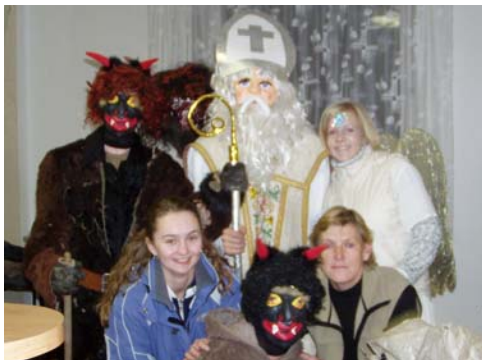
Ve středu 5. prosince 2007 chodil po vesnici Mikuláš,

a do zasedací místnosti OÚ přišel až v sobotu 8. prosince 2007