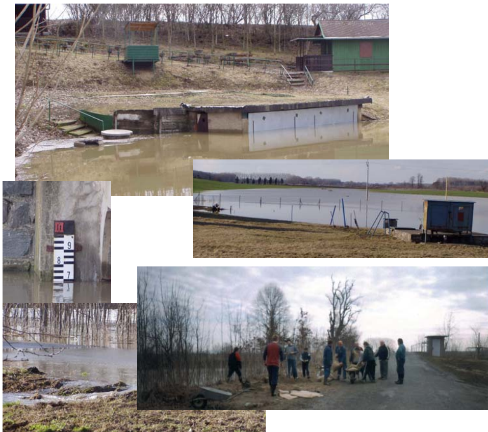
Několik snímků z nedávných záplav

15 000,00 2 000,00 10 000,00 826 000,00 2 690 000,00